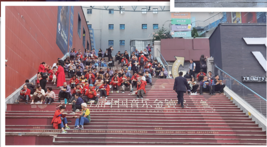
▲ 中午排練後每人領個飯盒坐在梯級上醫肚