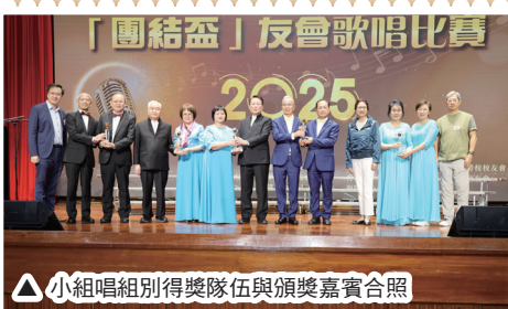
△ 小組唱組別得獎隊伍與頒獎嘉賓合照