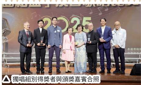
△ 獨唱組別得獎者與頒獎嘉賓合照