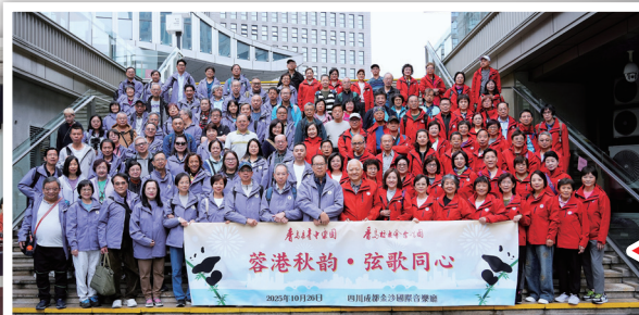
◀ 到達金沙國際音樂廳 來張大合影