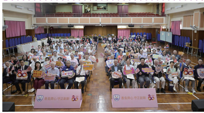
▲ 出席慶祝80週年校慶籌委大合照

各位校友，會訊改了版頭設計及名稱啦！「香島人」一個滿有親切感的身份認同。我們在每一期會訊，都會選用一位校友的「香島人」手書作為版頭。不論字體如何，只要你是校友，只要你提交，就有機會刊登。