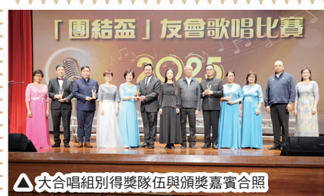
△ 大合唱組別得獎隊伍與頒獎嘉賓合照