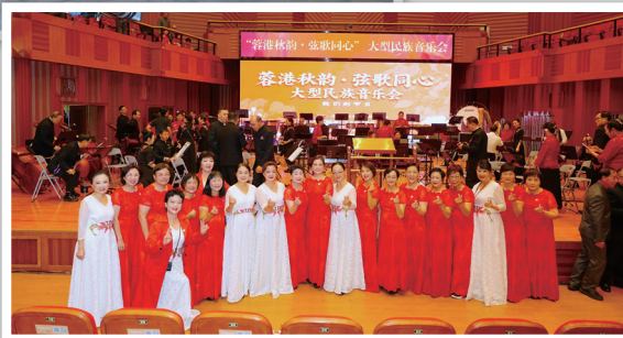
▲ 演出前兩個合唱團的女團員來張合影