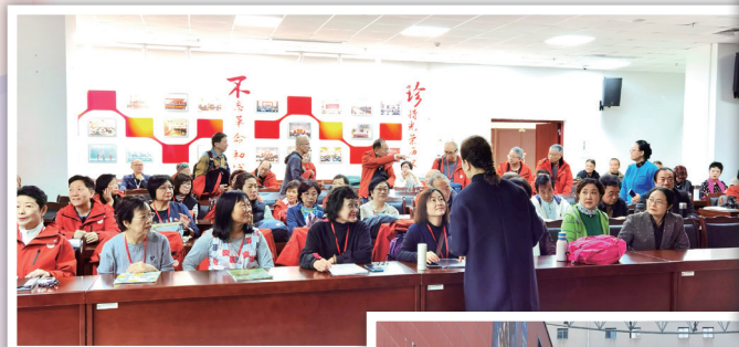
▲ 兩個合唱團也 勤力夾歌