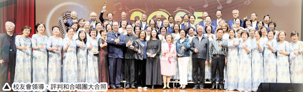
△ 校友會領導、評判和合唱團大合照