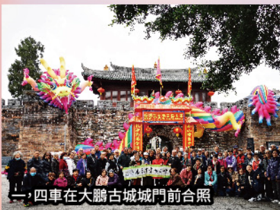
一，四車在大鵬古城城門前合照