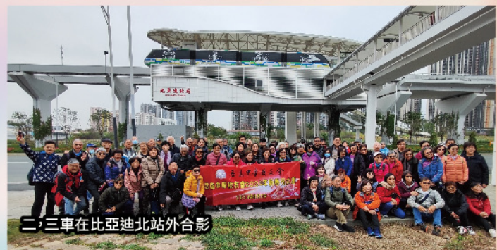
二，三車在比亞迪北站外合照