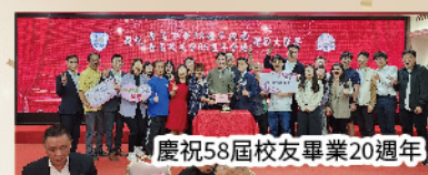
慶祝58屆校友畢業20週年