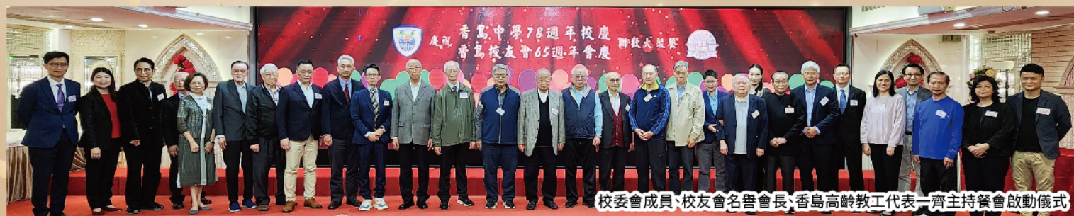
校委會成員、校友會名譽會長、香島高齡教工代表一齊主持餐會啟動儀式

3月22日在黃大仙富臨皇宮舉行了香島中學78週年校慶暨香島中學校友會65週年會慶聯歡餐會，當晚筵開75席，高朋滿座，近千人共聚，觥籌交錯，熱鬧非凡。