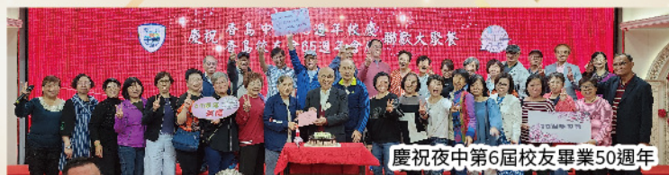
慶祝夜中第6屆校友畢業50週年