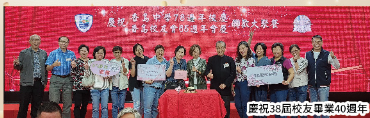
慶祝38屆校友畢業40週年