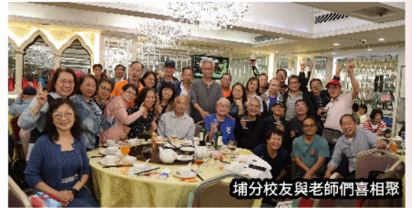
埔分校友與老師們喜相聚