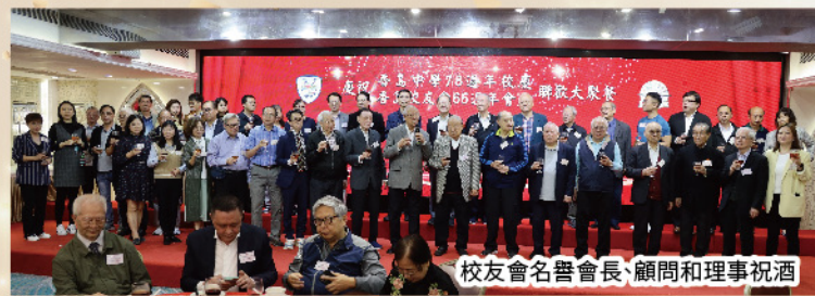
校友會名譽會長、顧問和理事祝酒