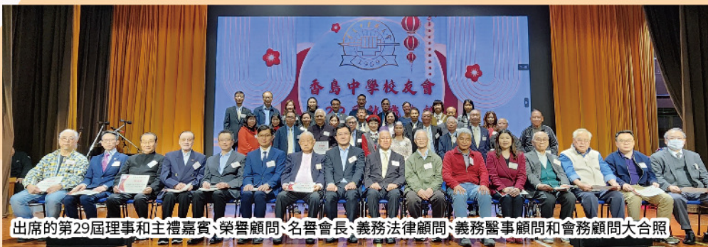
出席的第29屆理事和主禮嘉賓、榮譽顧問、名譽會長、義務法律顧問、義務醫事顧問和會務顧問大合照