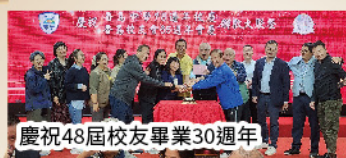
慶祝48屆校友畢業30週年