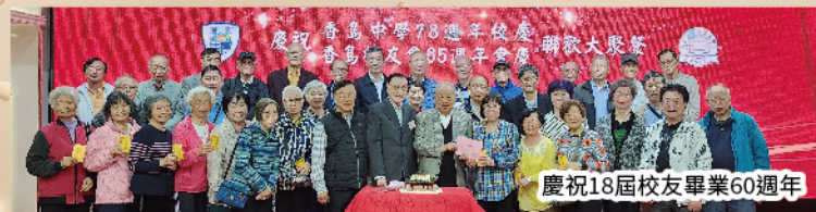
慶祝18屆校友畢業60週年