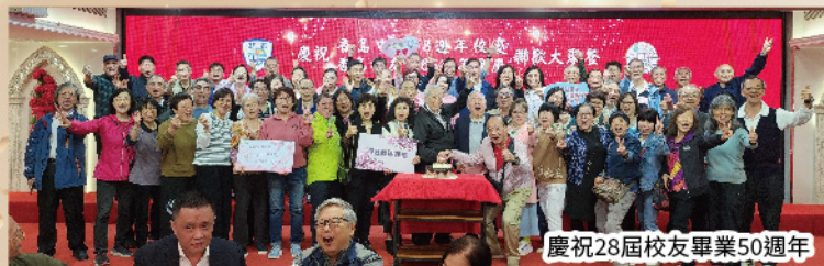
慶祝28屆校友畢業50週年